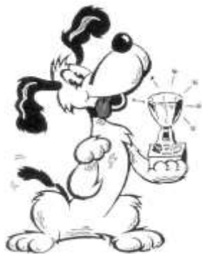
RAKVERE DOUBLE SHOWS

During the shows only for emergency call ph (+372) 521 9294